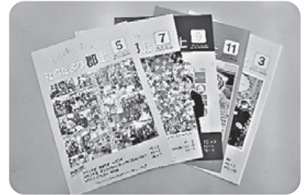
▲社協だより郡上の発行