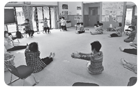
▲ふれあい・いきいきサロン支援事業