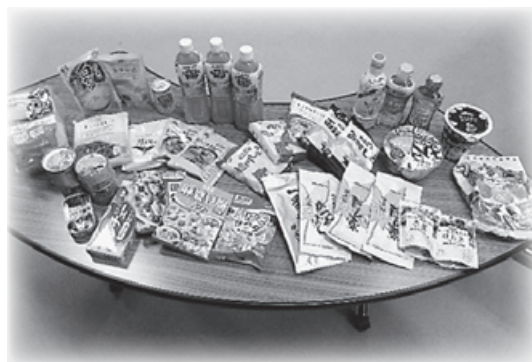
(写真は提供品の一部)