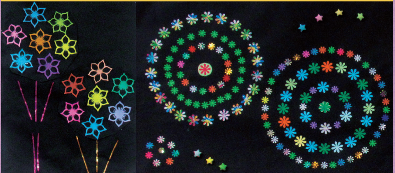
▲明宝デイサービスセンター作品「打ち上げ花火」